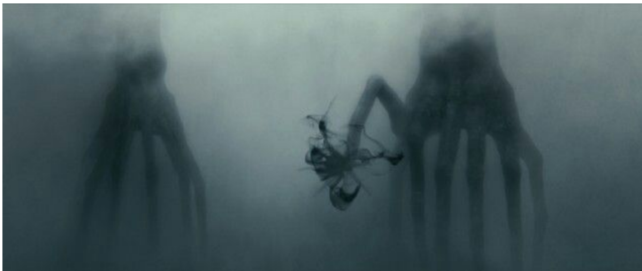
Immagine tratta dal film “Arrivals” di Denis Villeneuve – 2016