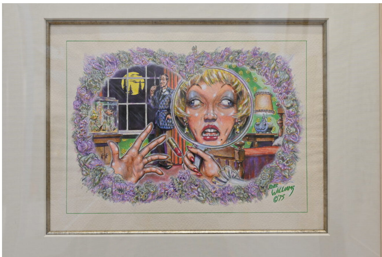
Robert Williams, Peripheral Bogies (1975)

L'edizione 2022 dell'OAF di Parigi presenta anche due programmi collaterali: The Underground is Always Outside curato da Aline Kominsky-Crumb and Dan Nadel sui fumetti underground che rimangono una delle forme d'arte più fraintese. Nati dall'impulso liberatorio della controcultura americana degli anni '60 e affinati negli anni '70 e '80, i comics hanno offerto a innumerevoli artisti uno sbocco per commenti culturali taglienti, umorismo assurdo, fioriture psichedeliche, autobiografia confessionale e fantasia a tutto campo.