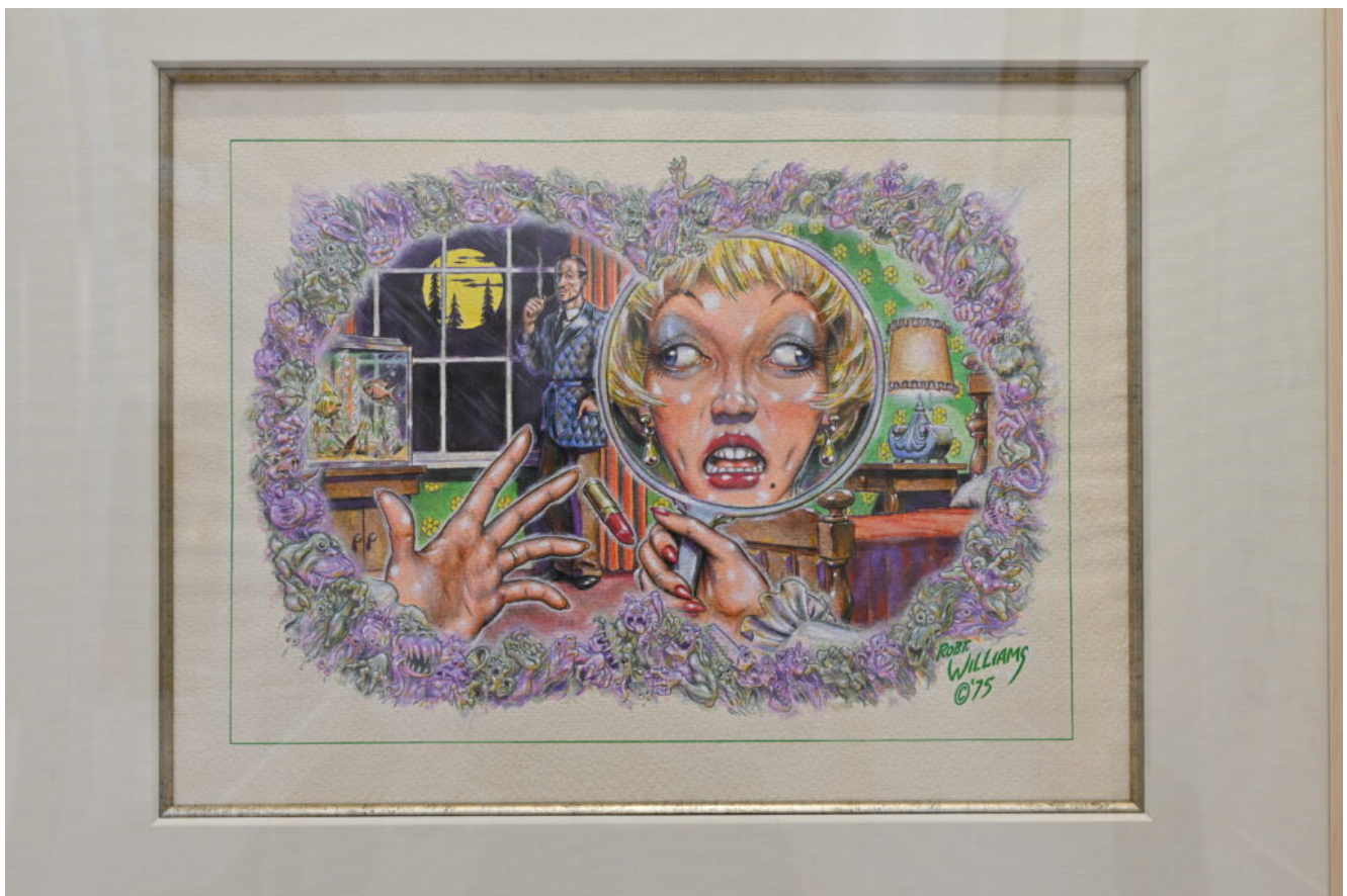
Robert Williams, Peripheral Bogies (1975)

L'edizione 2022 dell'OAF di Parigi presenta anche due programmi collaterali: The Underground is Always Outside curato da Aline Kominsky-Crumb and Dan Nadel sui fumetti underground che rimangono una delle forme d'arte più fraintese. Nati dall'impulso liberatorio della controcultura americana degli anni '60 e affinati negli anni '70 e '80, i comics hanno offerto a innumerevoli artisti uno sbocco per commenti culturali taglienti, umorismo assurdo, fioriture psichedeliche, autobiografia confessionale e fantasia a tutto campo.