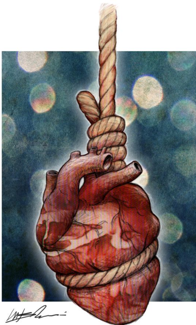
illustrazione Mario Barbieri (è vietata la riproduzione senza autorizzazione scritta).