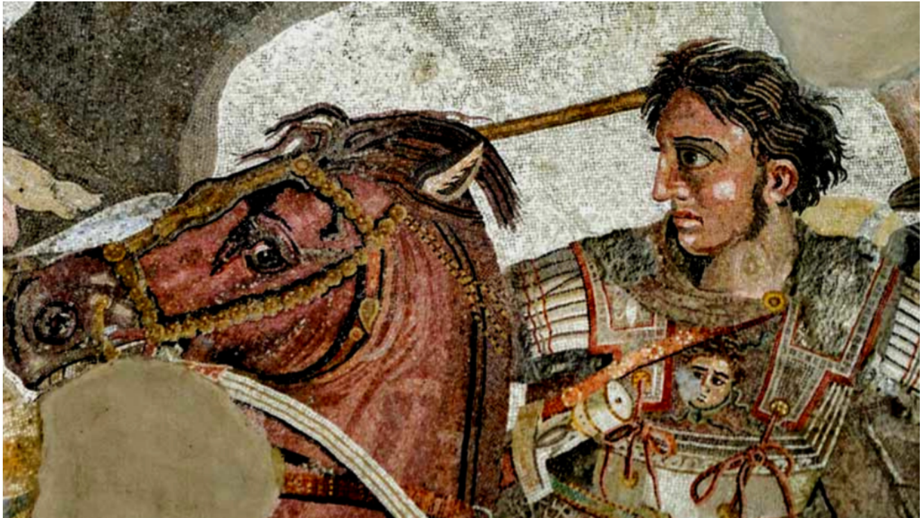
Pompei_Alexander Mosaic_Battaglia di Isso_333 BC_Particolare