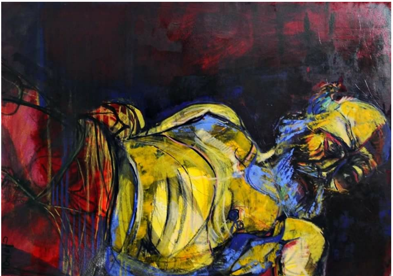
Giulia Gellini _"Rilettura"_tecnica mista.