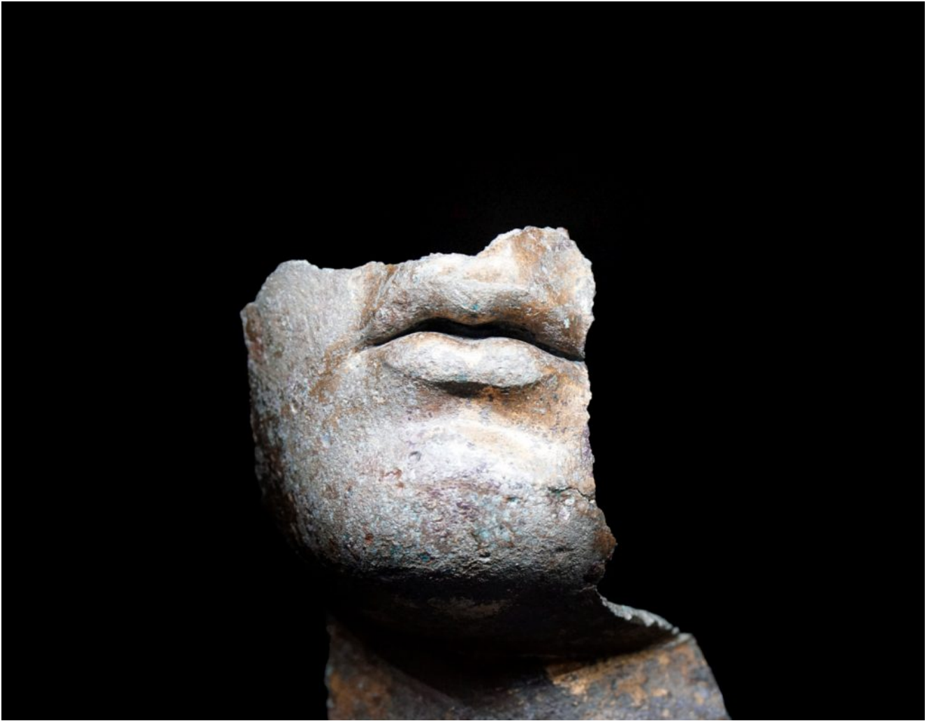
Foto di Mario Barbieri _"Il bacio non dato"_ E' vietata la riproduzione senza l'autorizzazione scritta dell'autore.