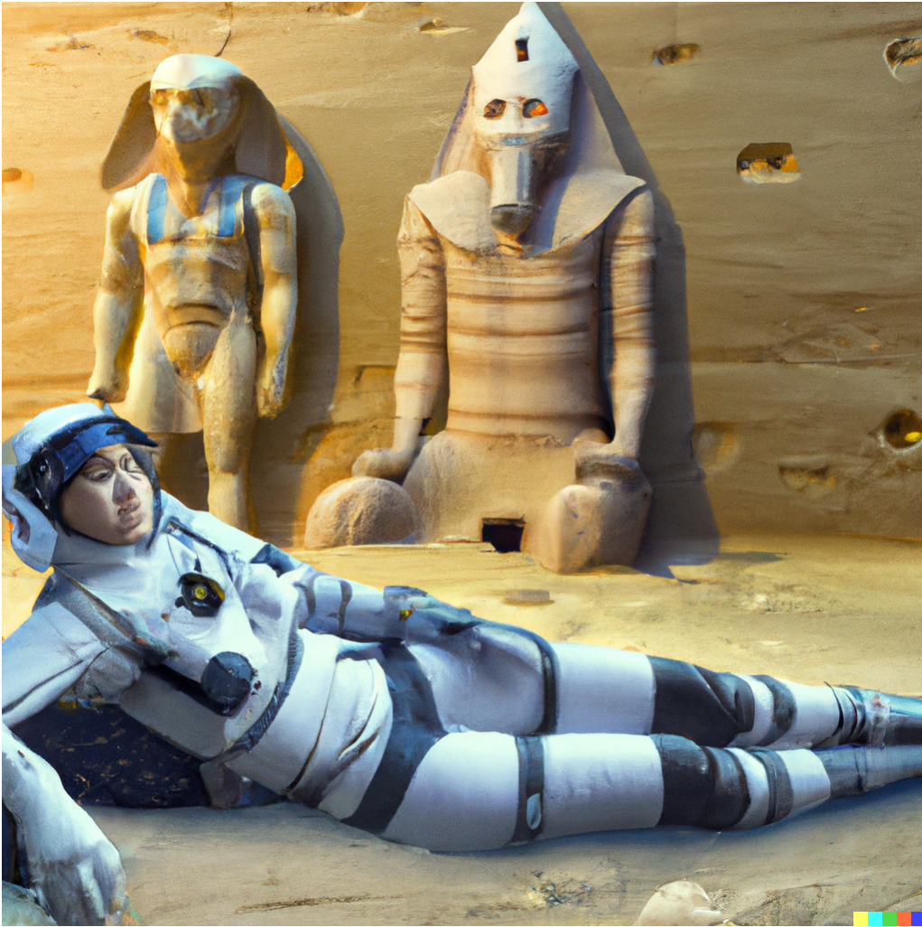
Immagine generata da DALL-E2 - ] https://openai.com/dall-e-2/ ] in base a Key Words estrapolate dall'articolo.