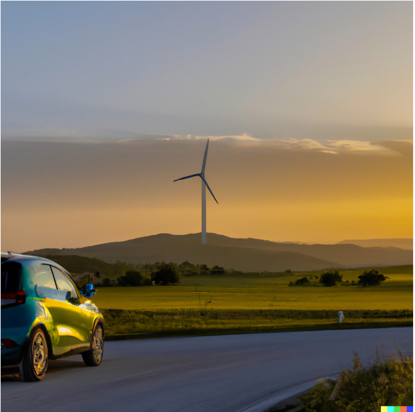
Immagine generata dal sistema di AI DALL-E in base a delle Key Words estrapolate dall'articolo.