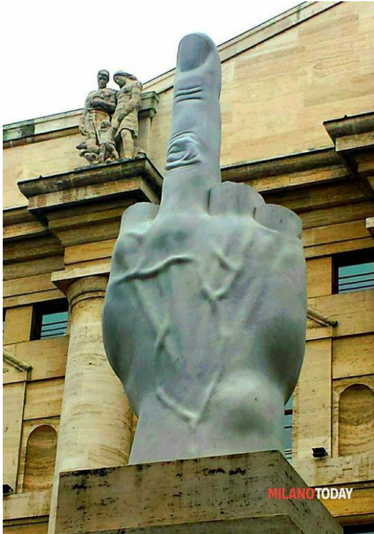
MAURIZIO CATTELAN_ L.O.V.E._Piazza Affari_Milano_ Immagine presa dal web_tanks to MILANO TODAY

Certo, il concetto, al lettore frettoloso e superficiale appare lo stesso, perfettamente identico, soprattutto se applichiamo la proprietà commutativa, trasferendola dall'aritmetica alle parole, cambiandone quindi l'ordine, ma lasciando invariato il significato.