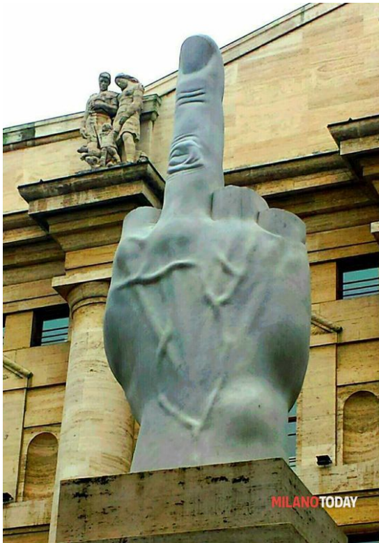
MAURIZIO CATTELAN_ L.O.V.E._Piazza Affari_Milano_ Immagine presa dal web_tanks to MILANO TODAY

Certo, il concetto, al lettore frettoloso e superficiale appare lo stesso, perfettamente identico, soprattutto se applichiamo la proprietà commutativa, trasferendola dall'aritmetica alle parole, cambiandone quindi l'ordine, ma lasciando invariato il significato.