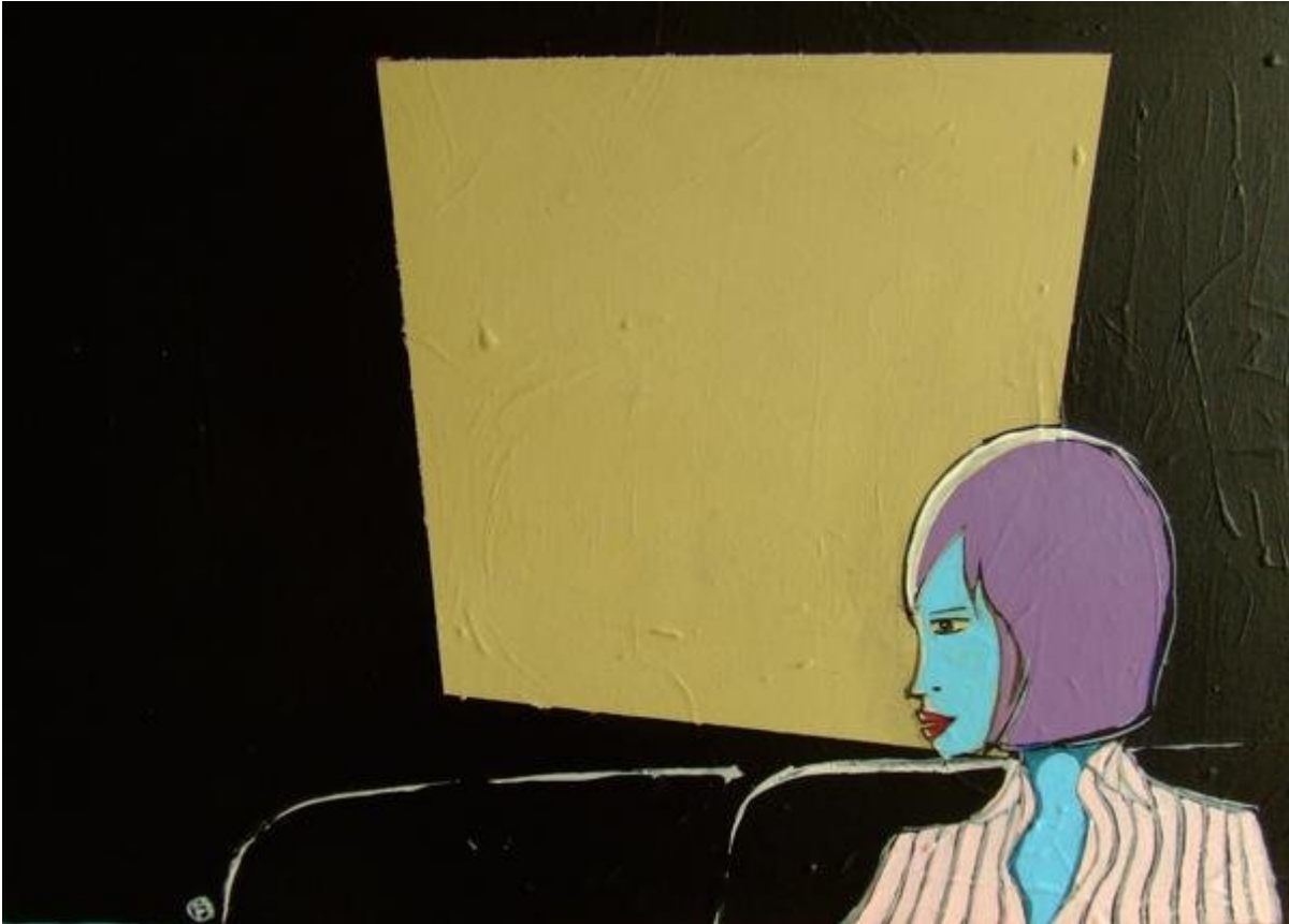
Illustrazione Federico Fossi vietata la riproduzione senza consenso scritto