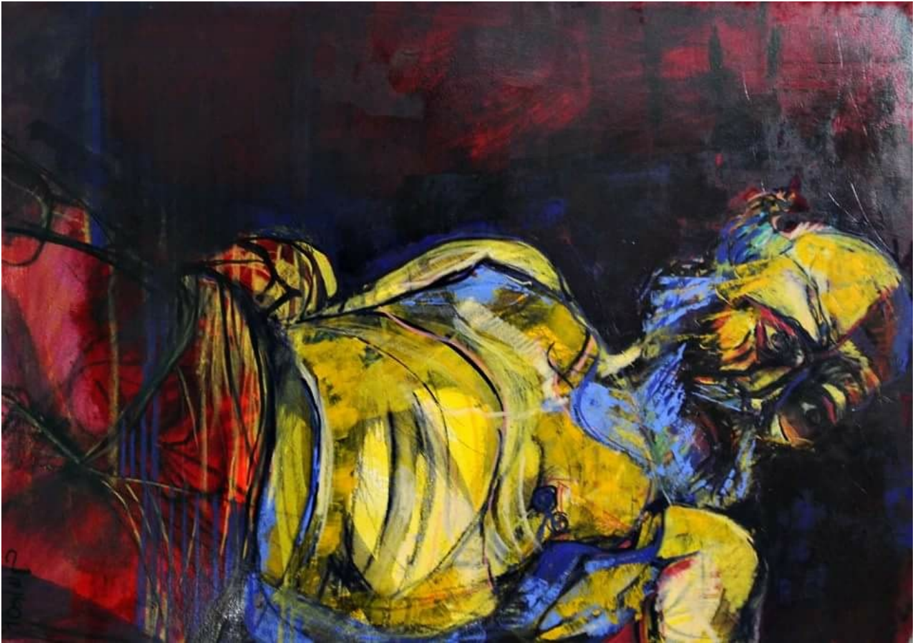
Giulia Gellini _"Rilettura"_tecnica mista.