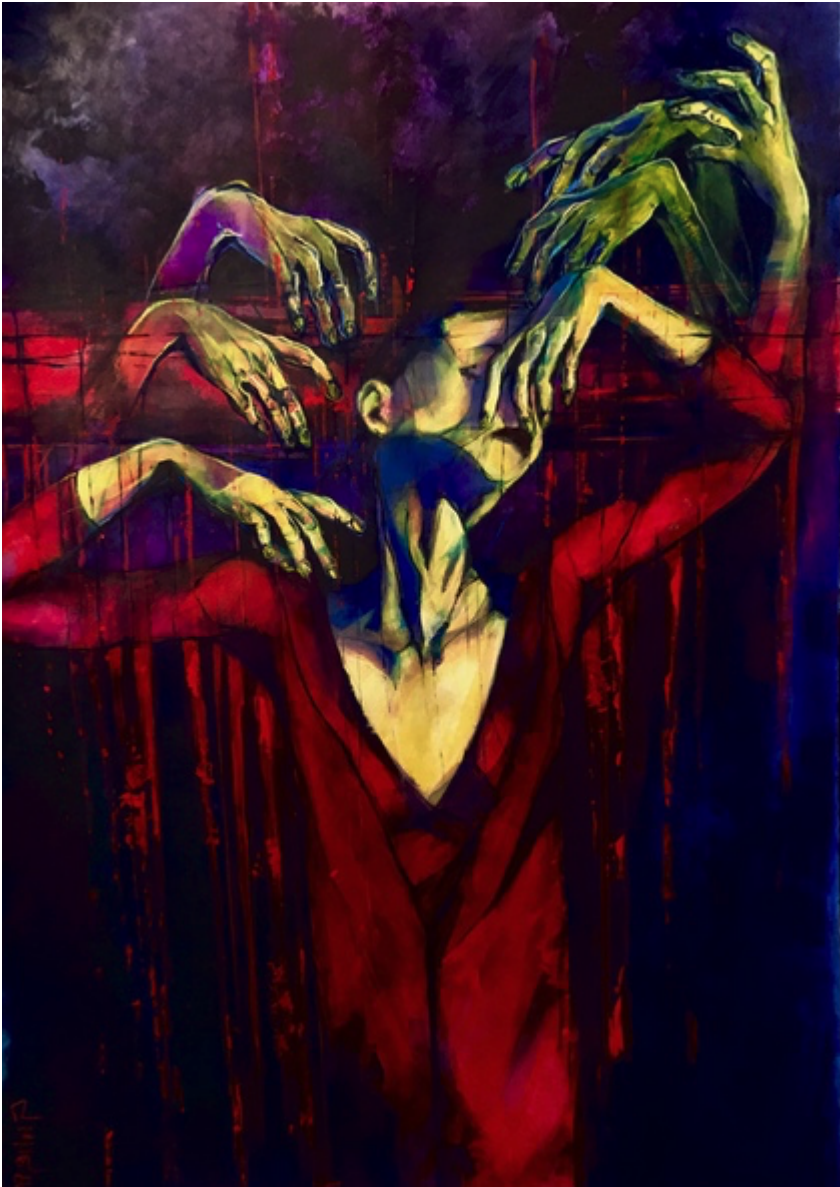
Giulia Gellini _Respiro libero_70 x 100_tecnica mista_2019 di Valeria Frascatore _

Viviamo una fase storica piuttosto delicata, carente a vari livelli sul piano formativo.