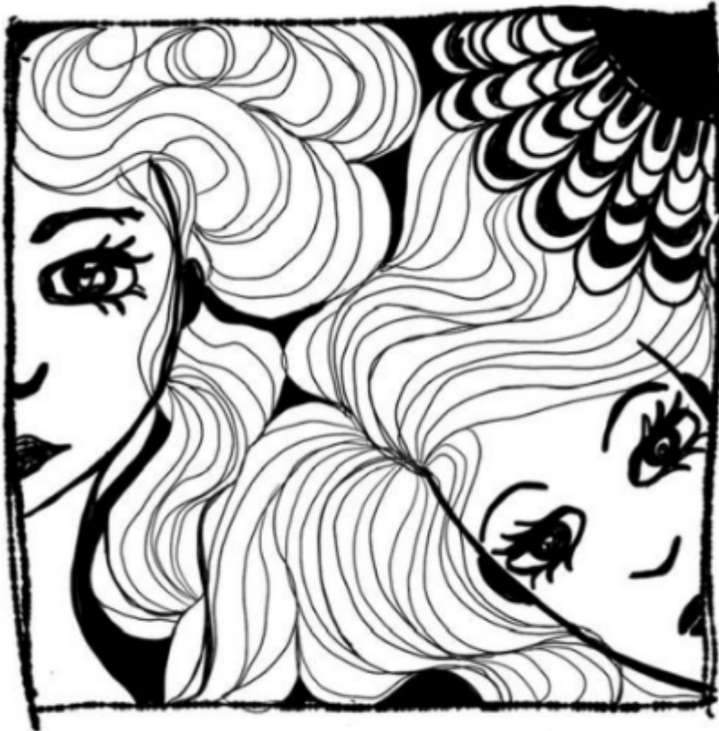
illustrazione di Anna La Tati Cervetto "Amiche" pennarello su carta_dicembre2020