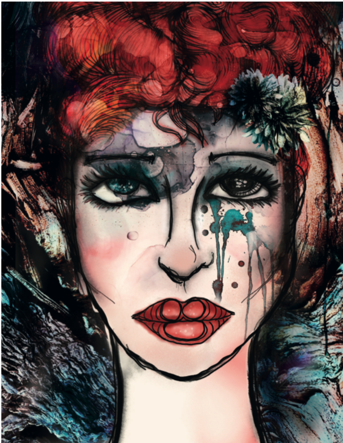
Anna La Tati Cervetto _Decadence_tecnica mista.