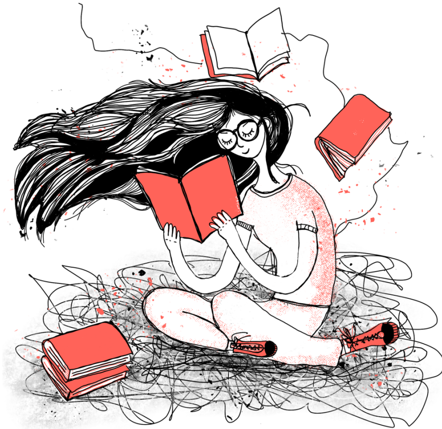
Illustrazione di Anna La Tati Cervetto