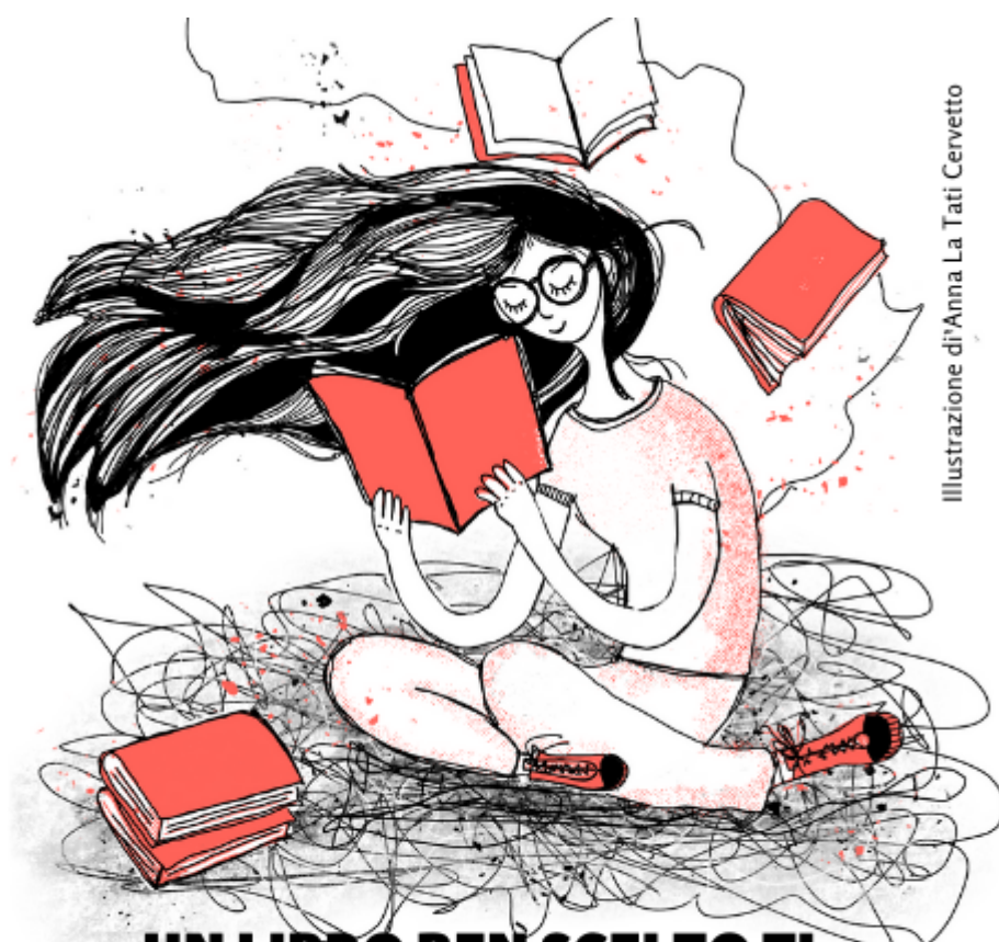
Illustrazione di Anna La Tati Cervetto