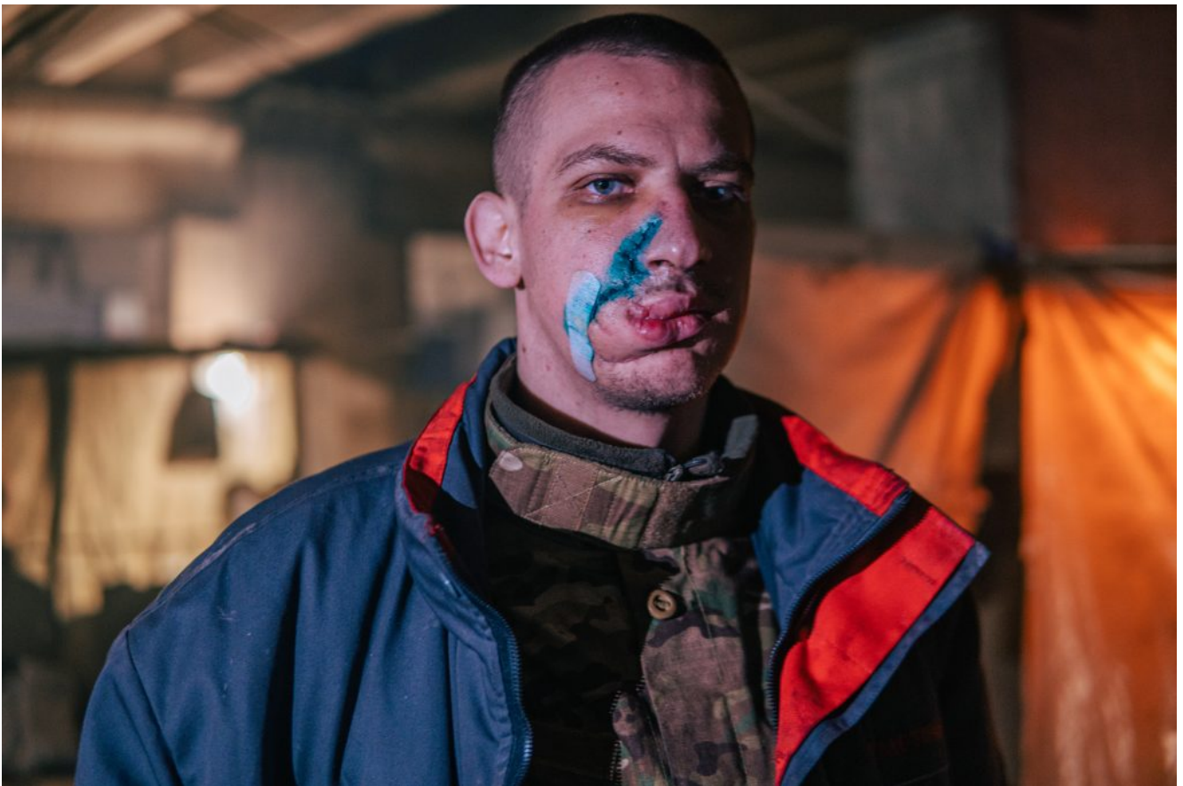
Alcune delle fotografie condivise da Dmytro Kozatskiy realizzate durante la resistenza nell'acciaiera Azovstal.