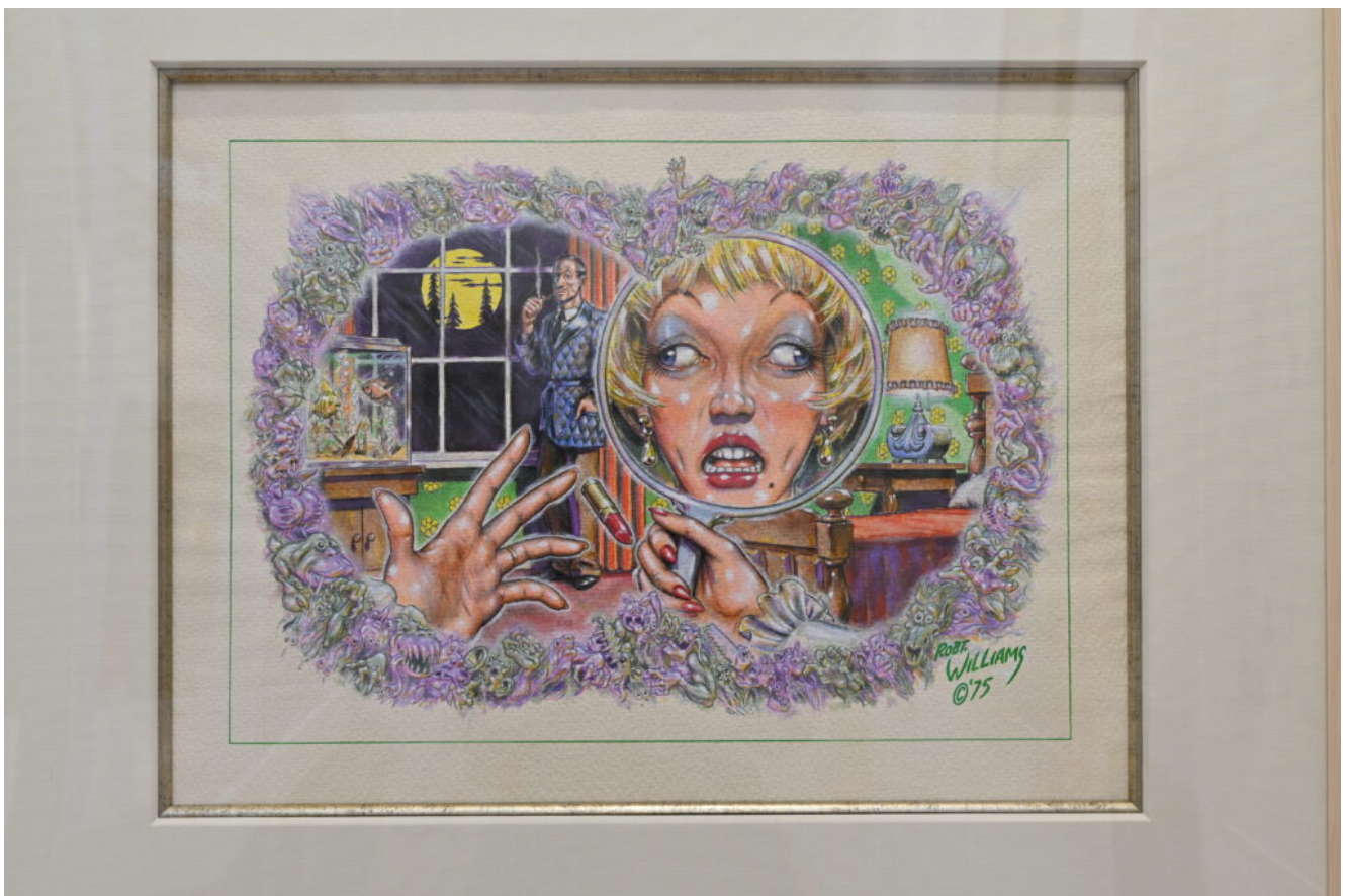
Robert Williams, Peripheral Bogies (1975)

L'edizione 2022 dell'OAF di Parigi presenta anche due programmi collaterali: The Underground is Always Outside curato da Aline Kominsky-Crumb and Dan Nadel sui fumetti underground che rimangono una delle forme d'arte più fraintese. Nati dall'impulso liberatorio della controcultura americana degli anni '60 e affinati negli anni '70 e '80, i comics hanno offerto a innumerevoli artisti uno sbocco per commenti culturali taglienti, umorismo assurdo, fioriture psichedeliche, autobiografia confessionale e fantasia a tutto campo.