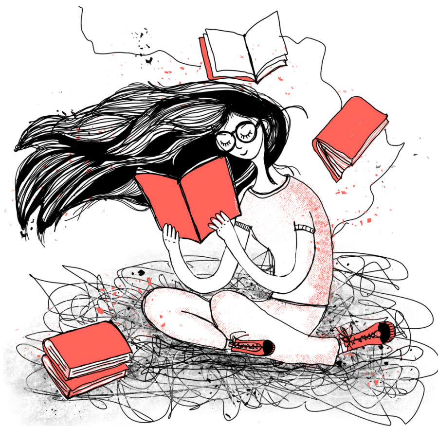
Illustrazione di Anna La Tati Cervetto