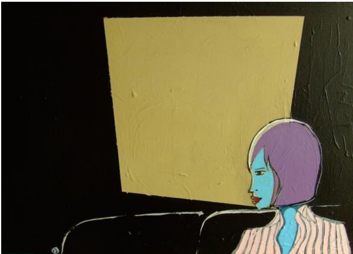
Illustrazione Federico Fossi vietata la riproduzione senza consenso scritto