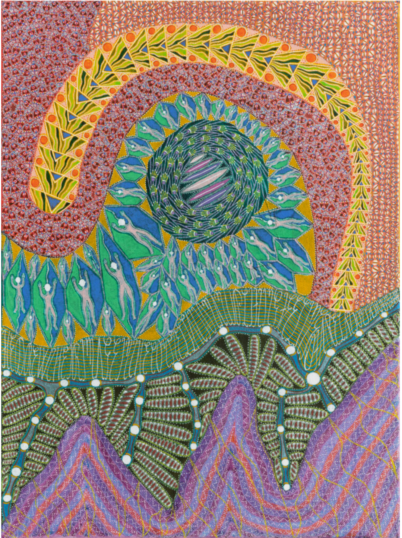
Domenico Zindato (b. 1966), Riding the Immanent , 2022