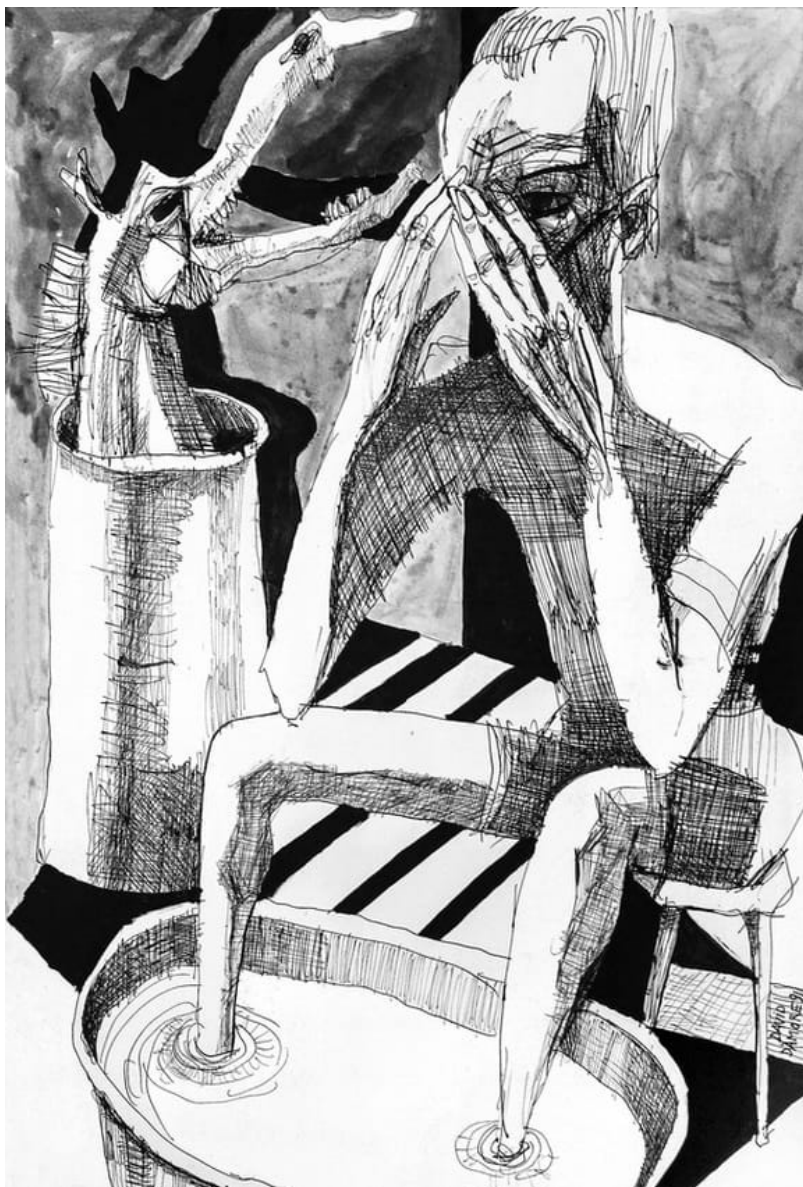
David D'Amore _ China su carta_1991