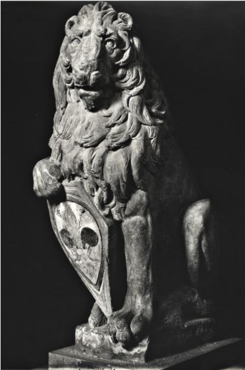
Il Marzocco originale di Donatello. 1419-20. Firenze, Museo del Bargello.