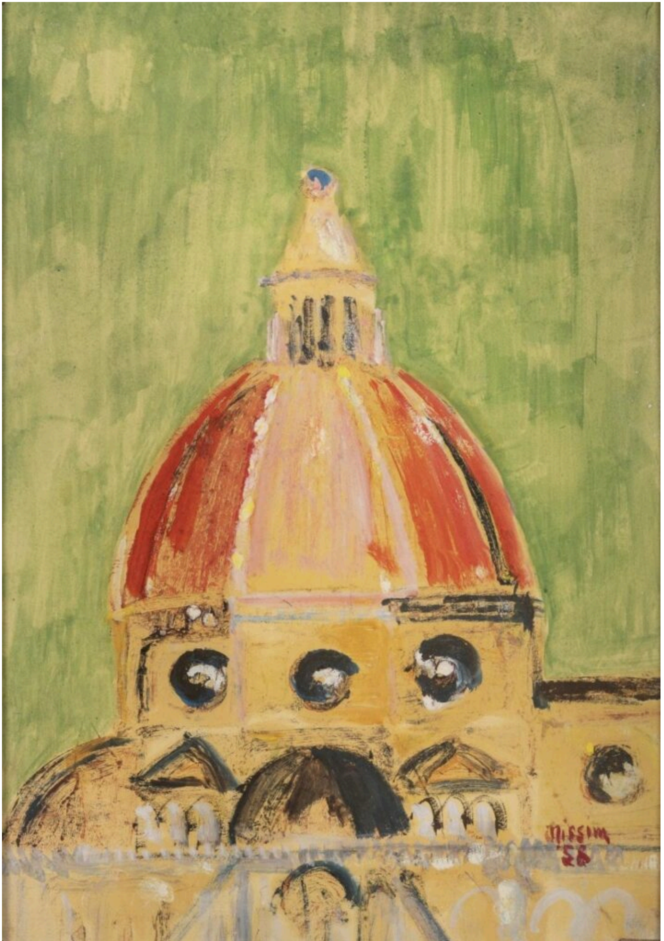
Renzo Nissim, Cupola di Santa Maria del Fiore, tecnica mista