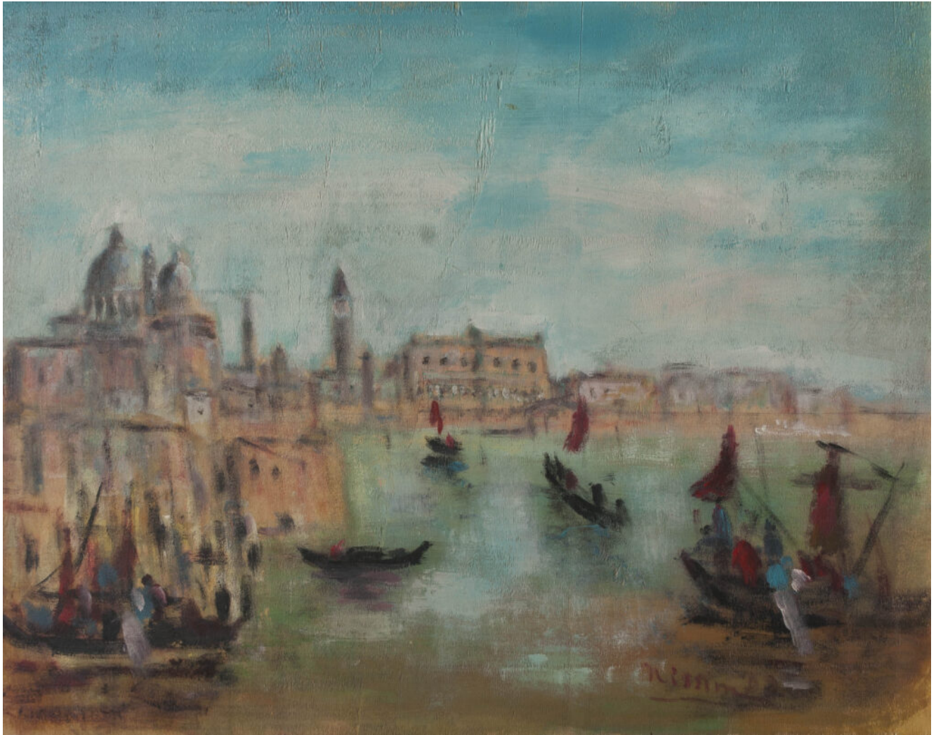
Renzo Nissim, Bacino di San Marco, 1992. Olio su tavola.