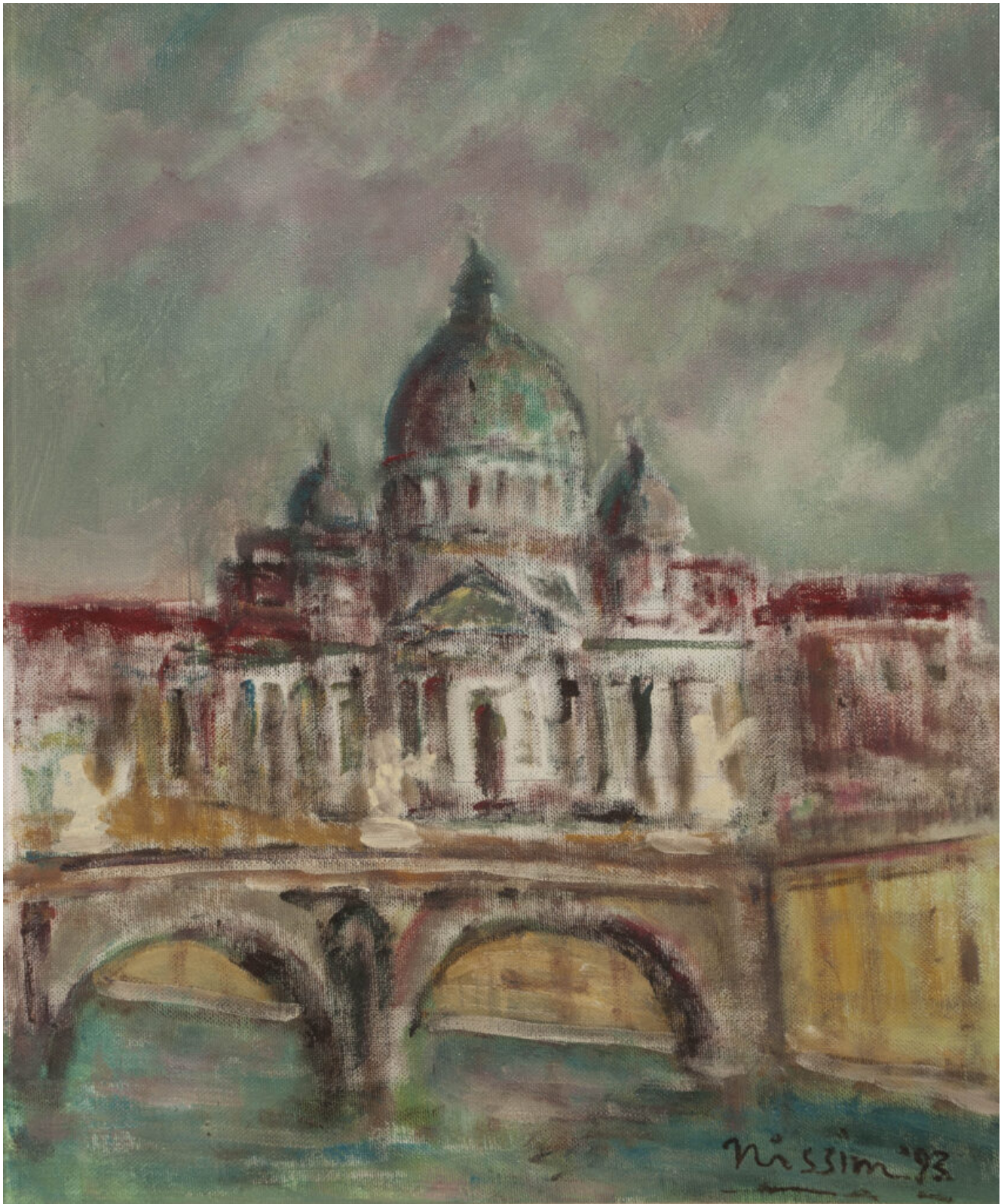
Renzo Nissim, San Pietro in Vaticano, 1993. Olio su tela.