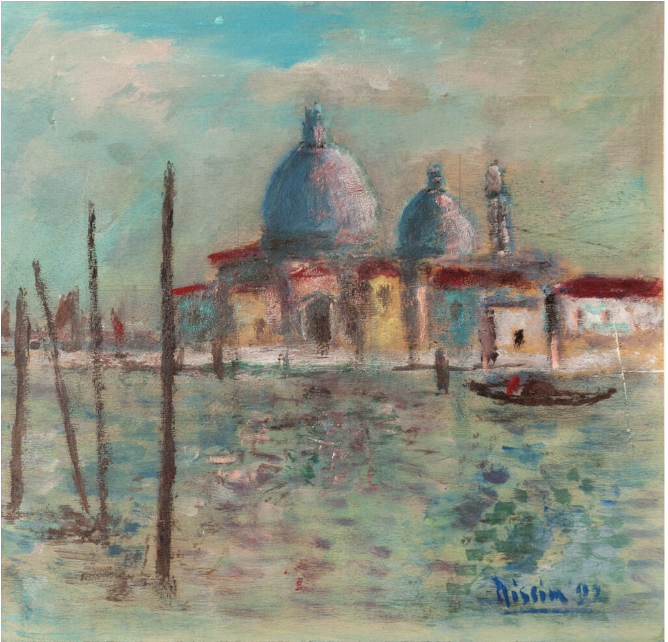
Renzo Nissim, Basilica della Salute, 1992. Olio su tavola.

Non tutta la produzione di Nissim può considerarsi memorabile; ma le vedute dei primi '90 (quando l'autore era già oltre gli 80 anni) sono certamente meritevoli di una certa attenzione; e soprattutto tra le opere di questo periodo abbiamo scelto quelle da pubblicare, insieme a quelle degli "esordi" ...da ultracinquantenne!