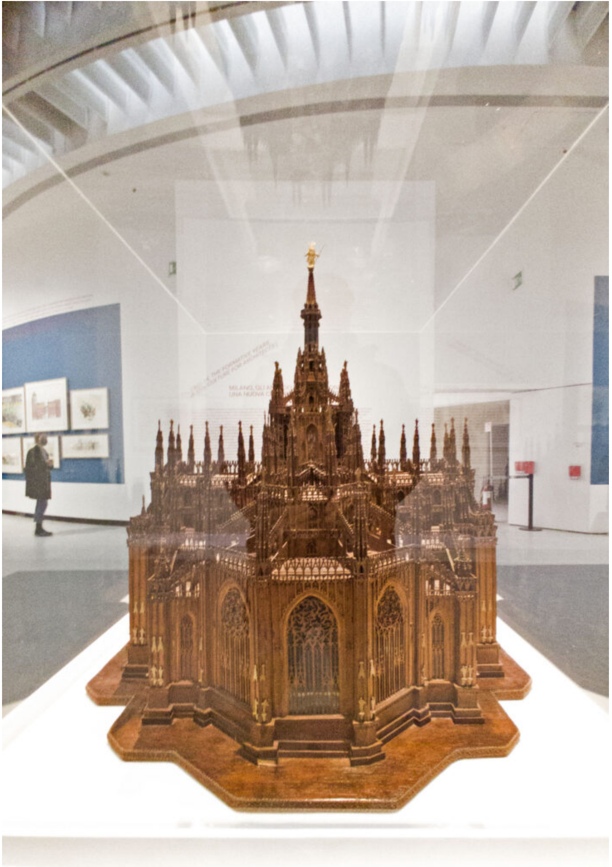
Modello ligneo del Duomo di Milano (Non è un progetto dell'Aldo, eh)