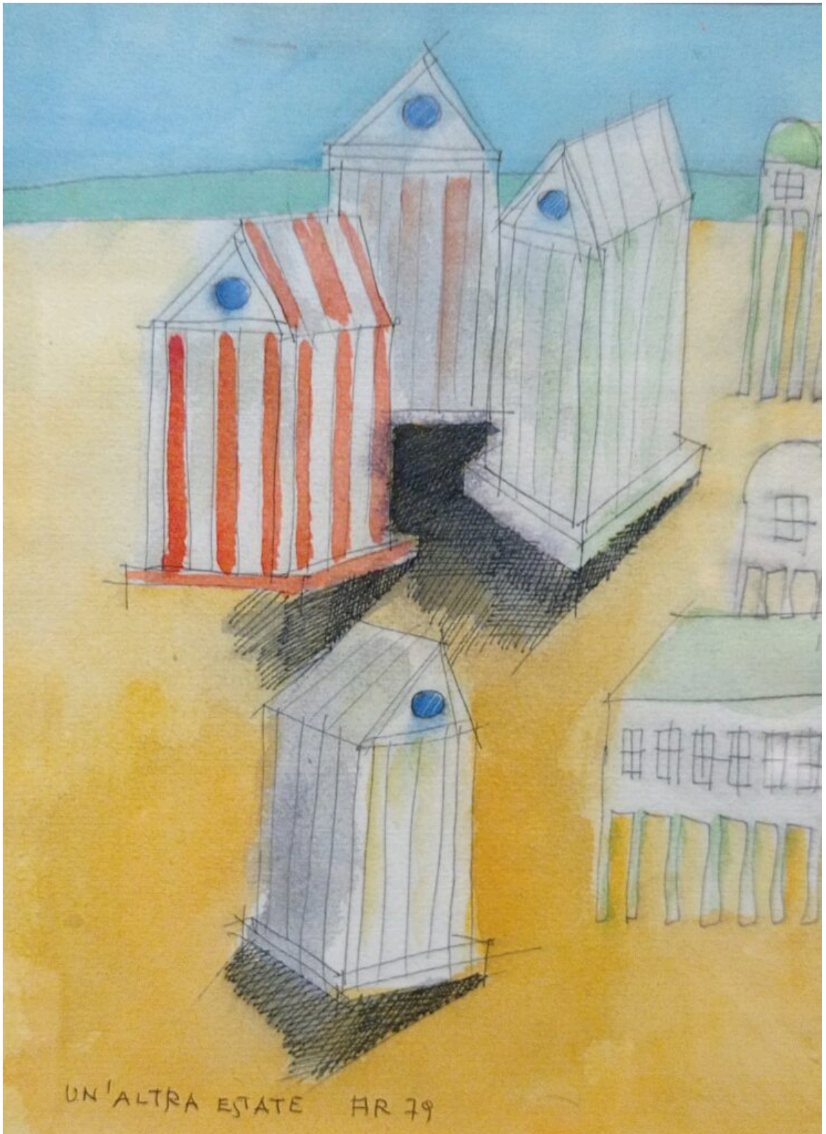
“Un'altra Estate, 1979”