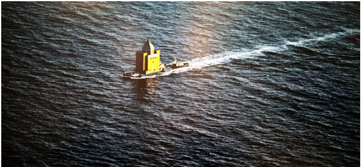
Il Teatro del Mondo in mezzo al mar