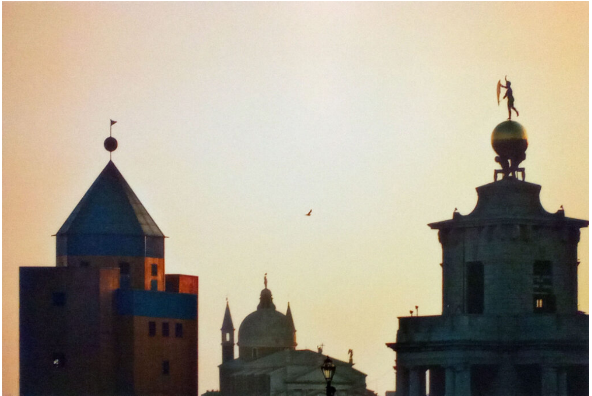
Venezia. Teatro del Mondo, Redentore e Punta della Dogana.