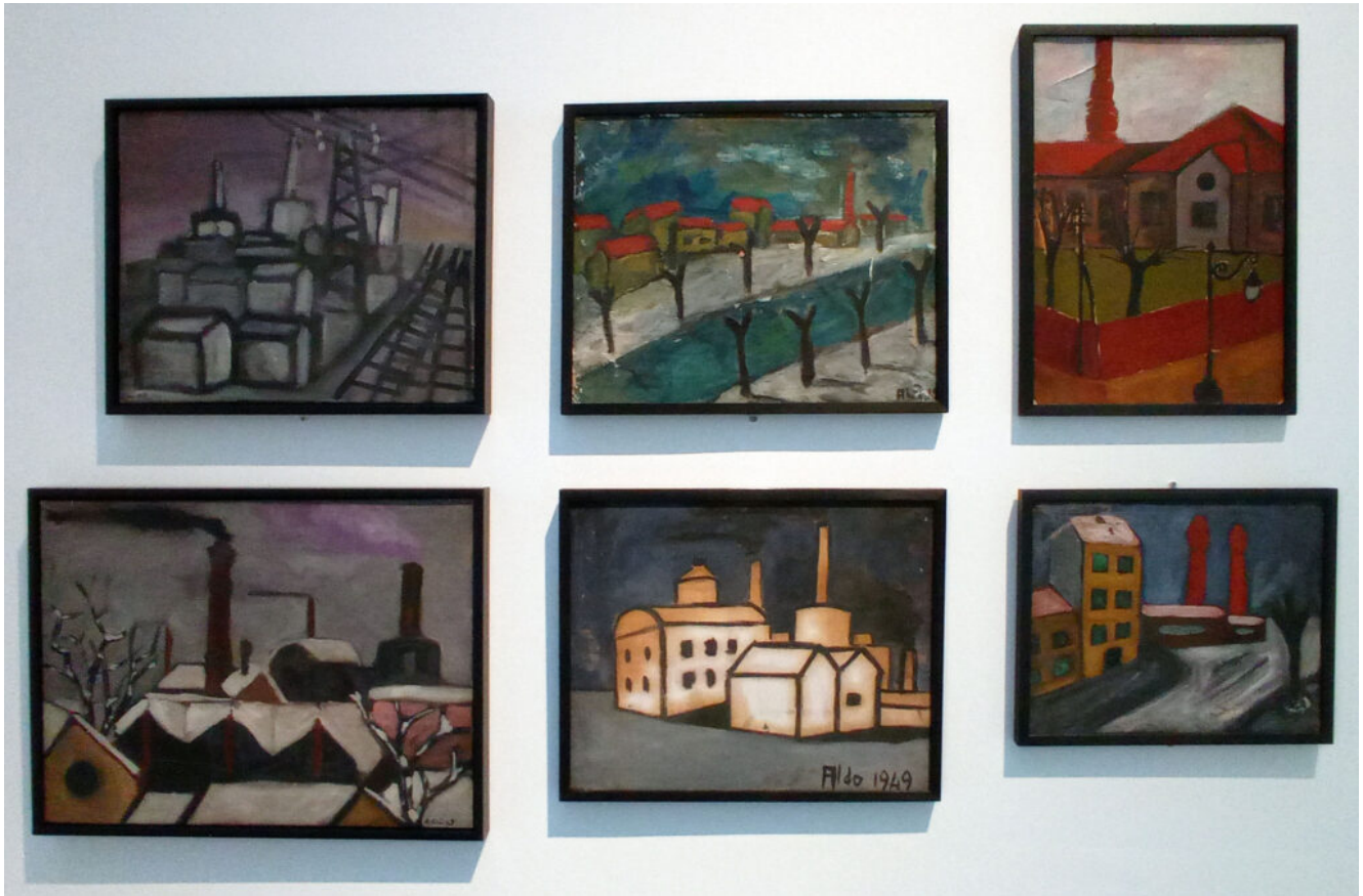
Dipinti di Aldo Rossi in mostra al Maxxi di Roma