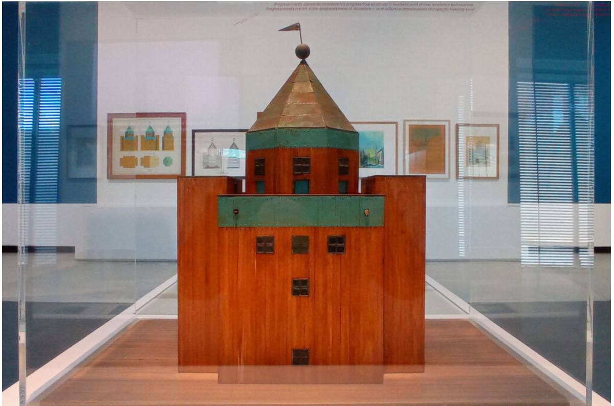
Modello del Teatro del Mondo