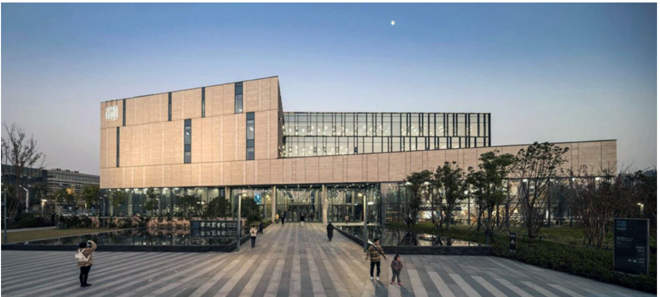
Ningbo New Library, Schmidt Hammer Lassen Architects

Ningbo è anche una città multiculturale, dove grattacieli moderni si mescolano ai palazzi costruiti dagli europei.