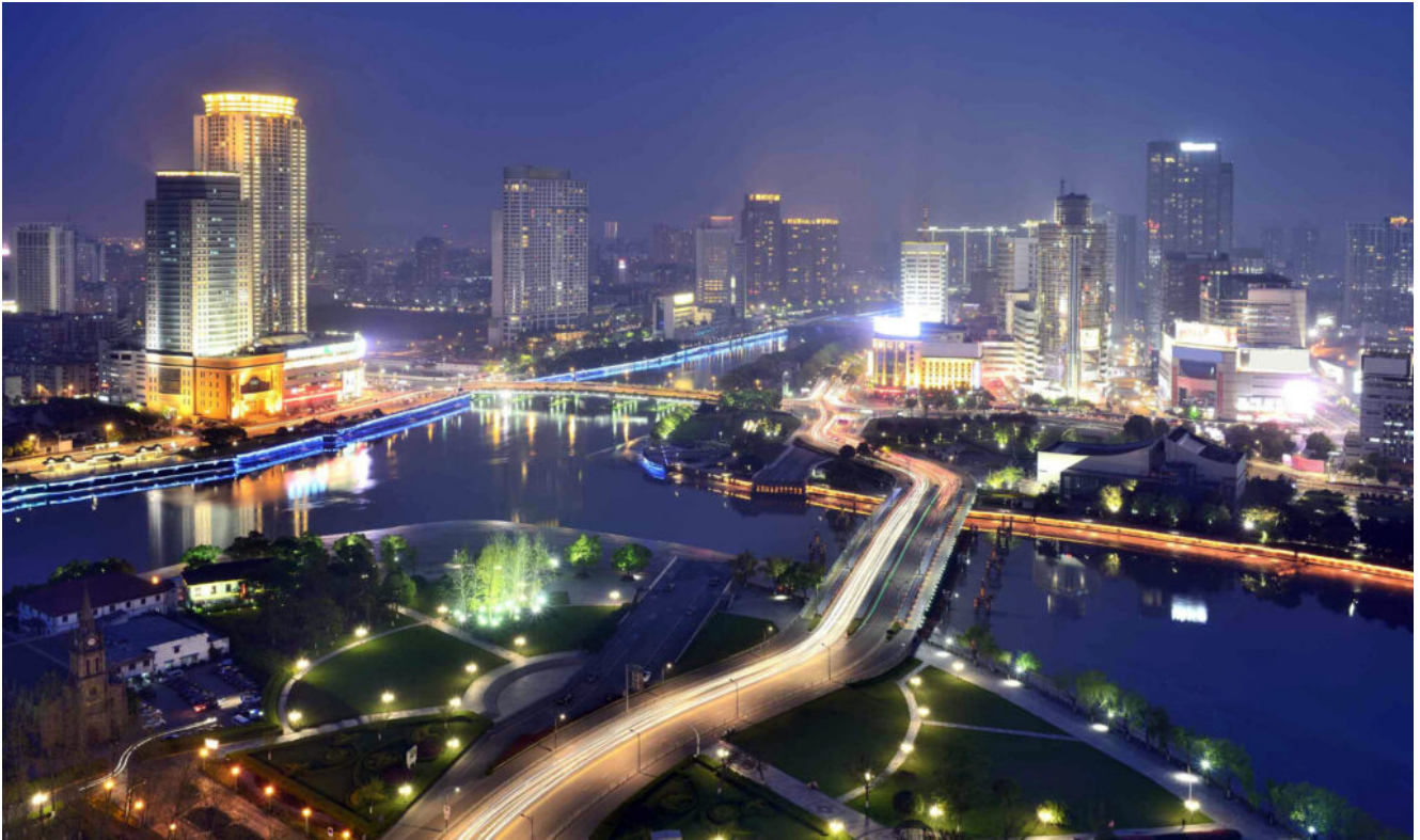
veduta notturna di Ningbo

Ningbo è anche una città multiculturale, dove grattacieli moderni si mescolano ai palazzi costruiti dagli europei.