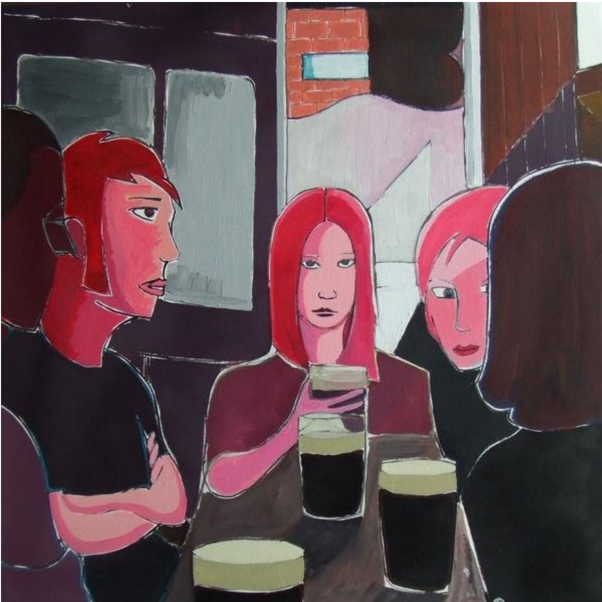
Illustrazione Federico Fossi _ vietata la riproduzione senza consenso scritto

“Un libro ben scelto ti salva da qualsiasi cosa. Persino da te stesso”