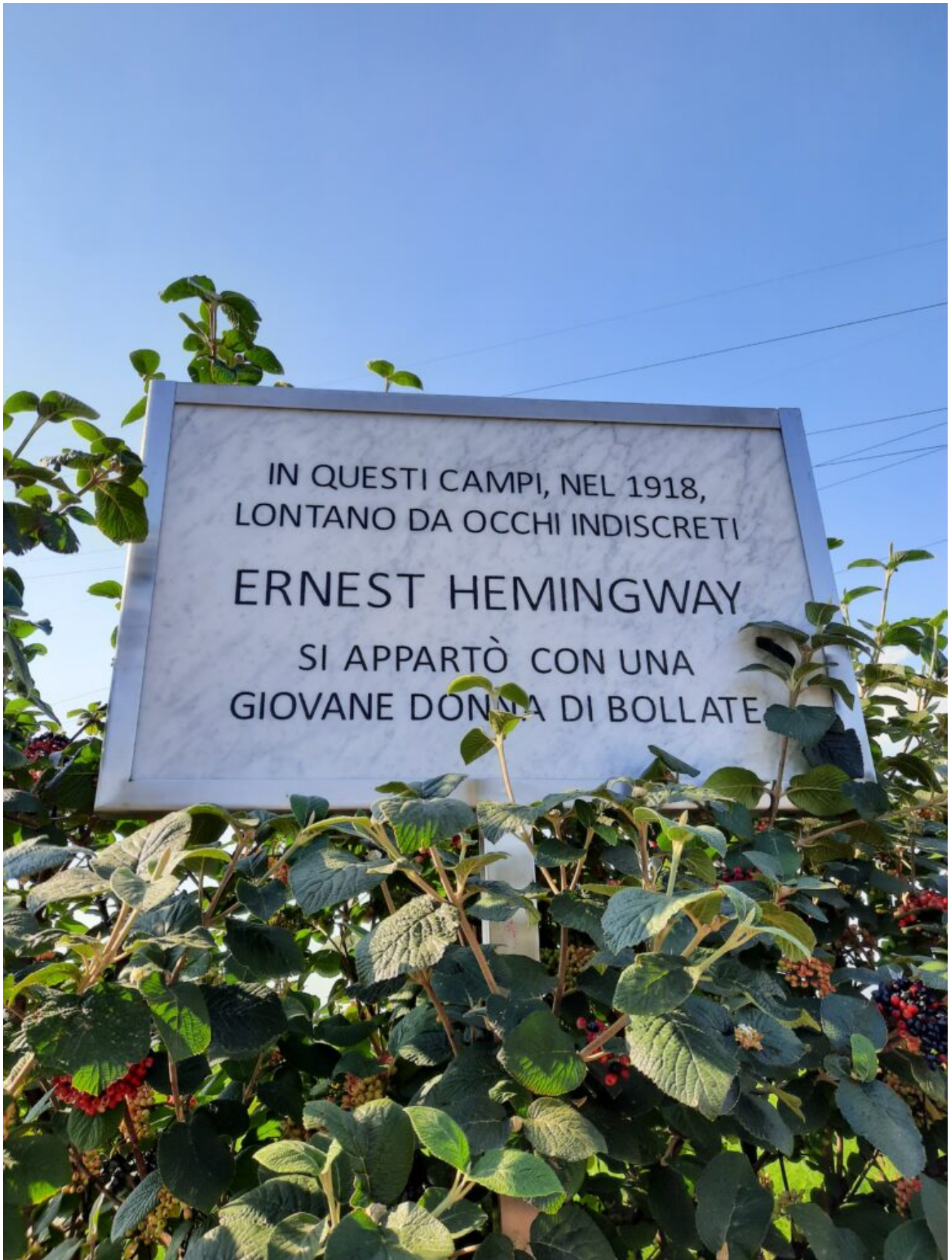
Il Cartello di Bollate