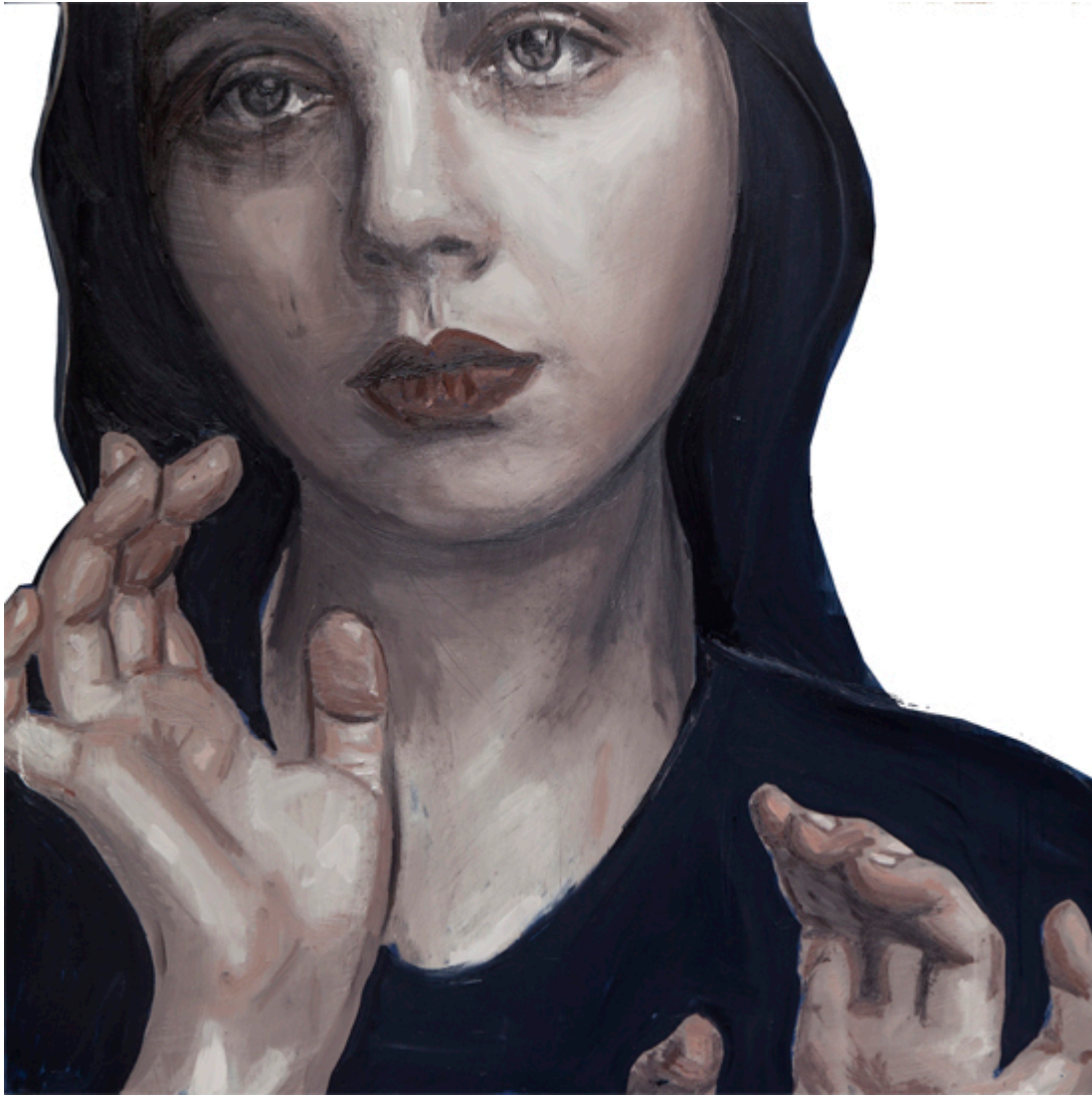
Mirabilis_Olio su tela e pigmento_150x150

Che il valore dell'arte dipenda solo o prevalentemente dal suo valore estetico è sostanzialmente una idea che ci piace pensare che sia vera. Ma, partendo da questo presupposto, come può avere successo un'artista che non tiene in considerazione primaria il valore estetico e magari si esprime attraverso corpi smembrati (è un esempio).