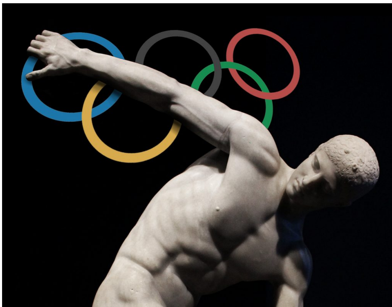
Immagine grafica_ Mario Barbieri.