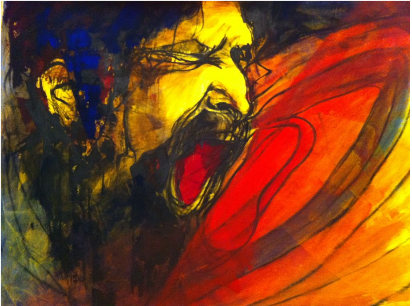
Giulia Gellini _ Grido_ 70 x 50 cm _Tecnica mista. di Christian Lezzi _

Che strano suono, per nulla rilassante, veicola con sé la parola " parossismo ". Anche se non la conosci, se non sai cosa realmente significhi, la percepisci a pelle come qualcosa di pericoloso, di ostico e spinoso, da cui tenersi alla larga, da evitare, che può farti del male.