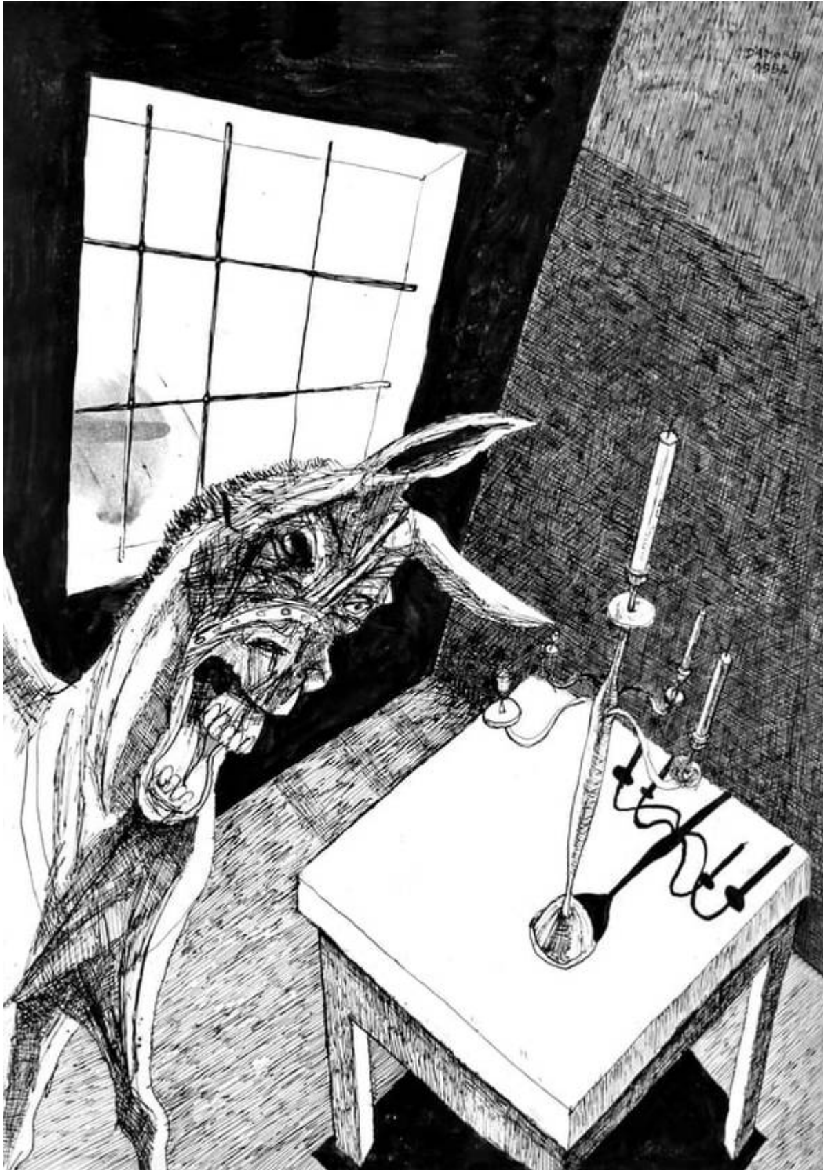
David D'Amore _Donkey_China su carta.

Nessuno è escluso. Ormai sdoganato come insulto, spesso riferito a noi stessi tutte le volte che ci sembrava assurdo