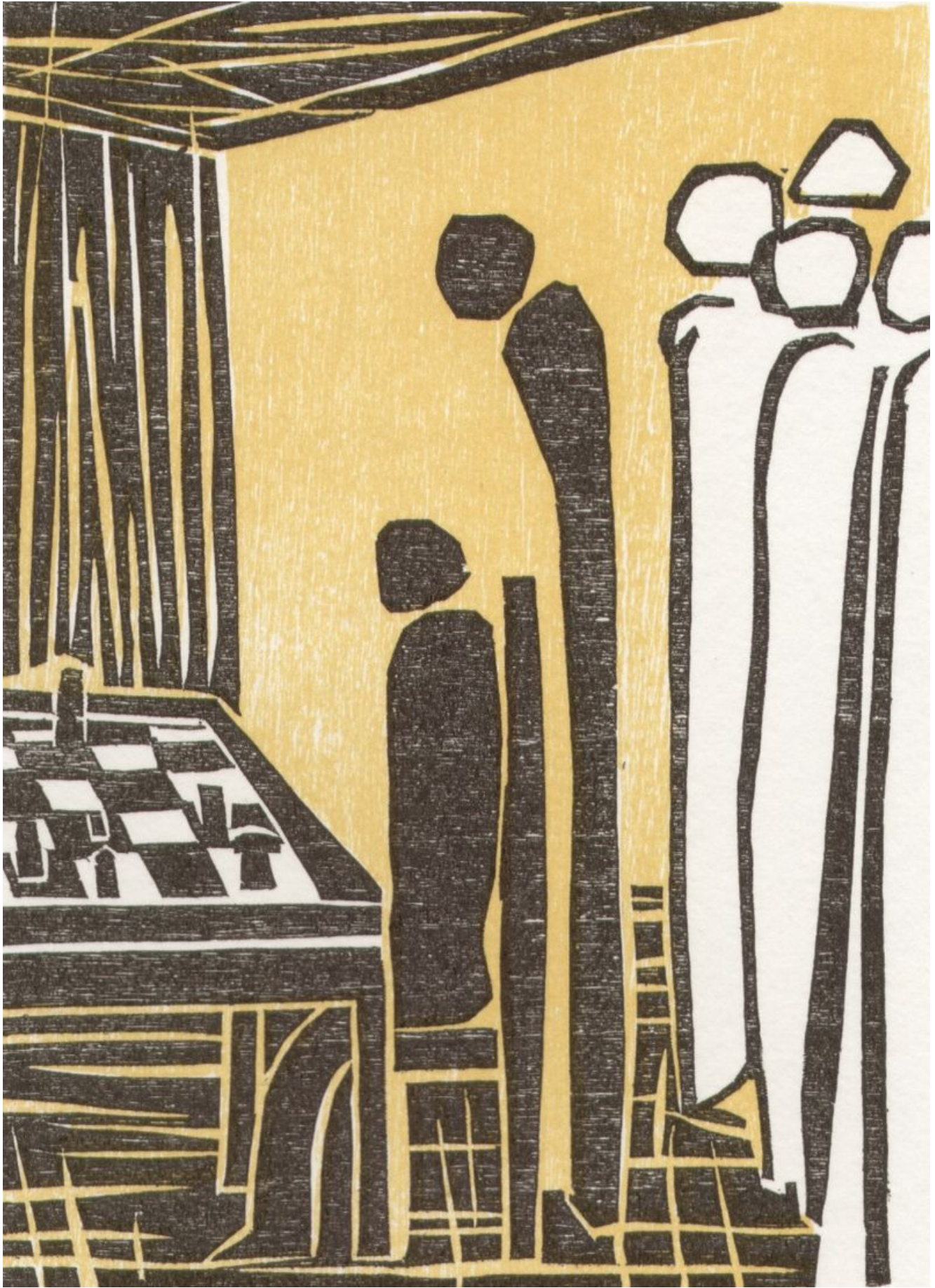
One of six woodcuts to the chess story The Royal Game by Stefan Zweig. Artist: Elke Rehder, Germany. di Borislav Mancini_