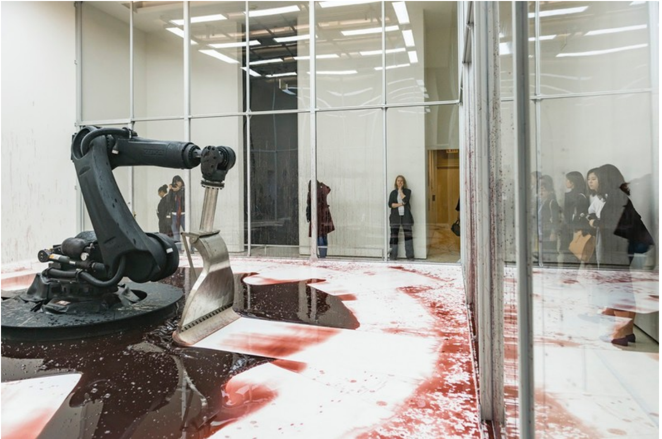
Can't Help Myself 2016 – Sun Yuan e Peng Yu