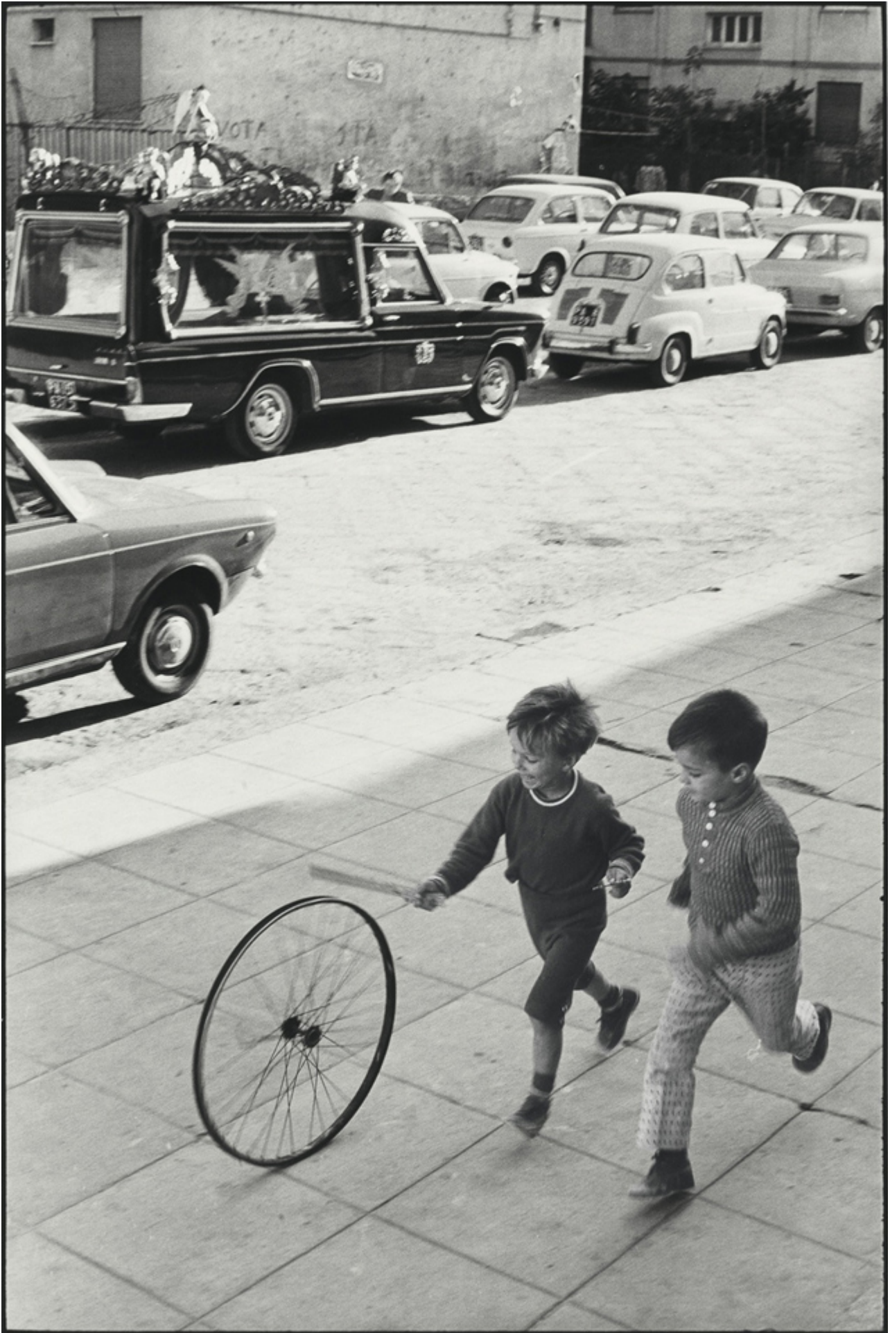
Palermo, 1971.