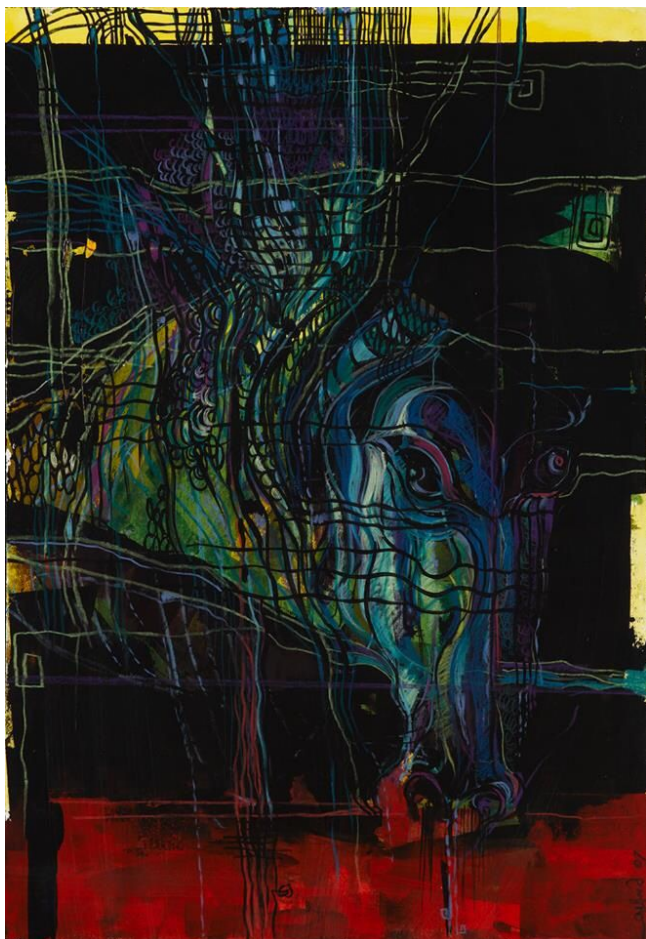
Giulia Gellini _ Equino [2009]_tecnica mista.