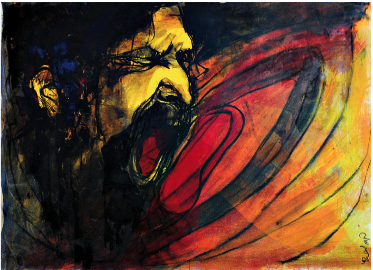
Frank Zappa - Tecnica mista 70 x 50 cm • 2012

Frank Zappa – Tecnica mista 70 x 50 – 2012