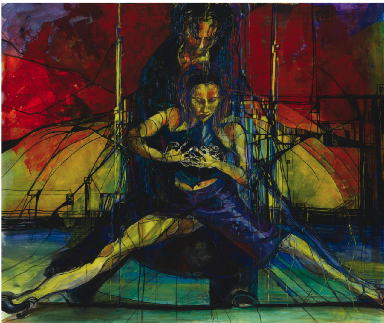
E' possibile - Tecnica mista 120 x 100 cm • 2009

Ritengo che la mia sensibilità musicale sia un fattore importantissimo, perché la manifesto anche attraverso l'espressività corporea della danza e in particolare del Tango. Questa per me è un'altra forma di energia fondamentale per la mia espressione pittorica, quasi un completamento del mio modus vivendi e dunque della mia arte.