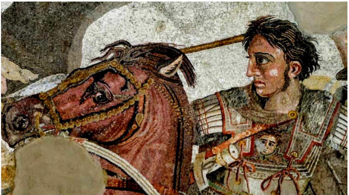
Pompei_Alexander Mosaic_Battaglia di Issa_333 BC_Particolare